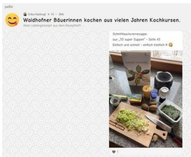
Waidhofner Bäuerinnen kochen aus vielen Jahren Kochkursen. Mein Lieblingsrezept aus dem Rezeptheft .... © Die Bäuerinnen im Bezirk Waidhofen/Thaya

Wir Funktionärinnen im Bezirksvorstand haben uns Gedanken gemacht, wie wir unsere Mitglieder unterstützen können und wie wir auch trotz der fehlenden Kurse, Bäderfahrten, Tag der Bäuerinnen miteinander in Kontakt bleiben. Wir haben ja in den vergangenen Jahren und Jahrzehnten schon soviele Koch- und Backkurse absolviert.